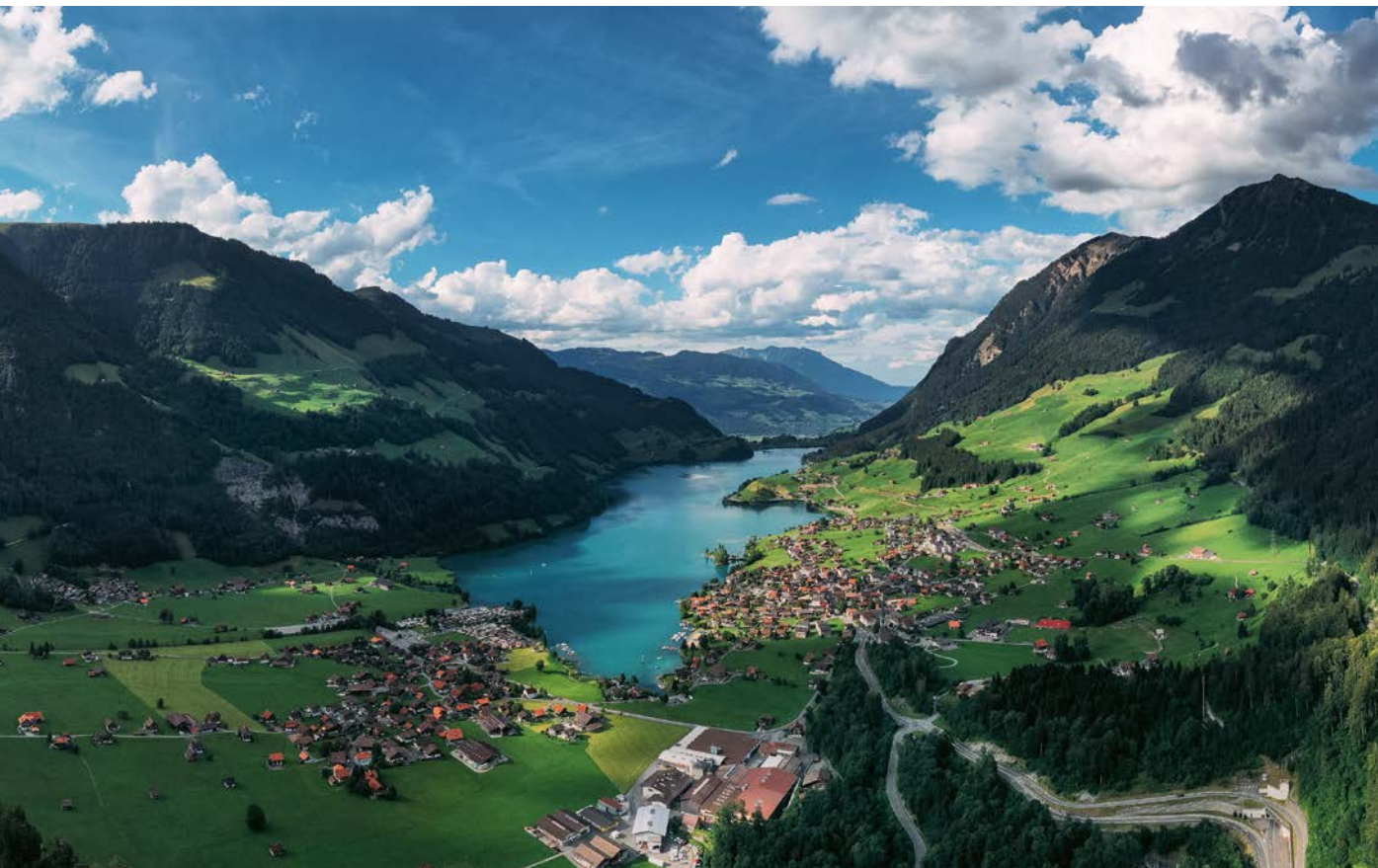
Vue du col de Brüning sur Lungern vers le Kaiserstuhl

contact@topakustik.ch www.topakustik.ch T +41 41 679 73 73